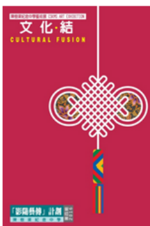
陳樹渠紀念中學聯同藝術團體W-studio合辦「文化·結」主題展覽將展出多件藝術品。