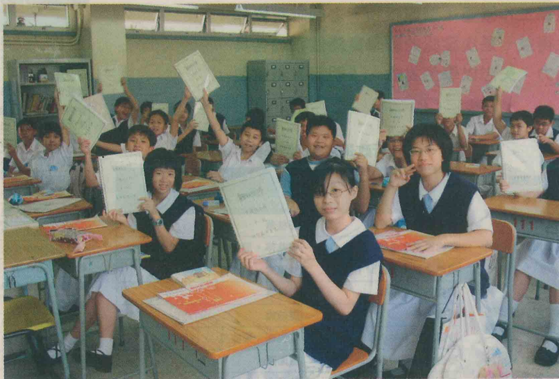
▲同學們高舉的就是學校老師精選的自學篇章文集。