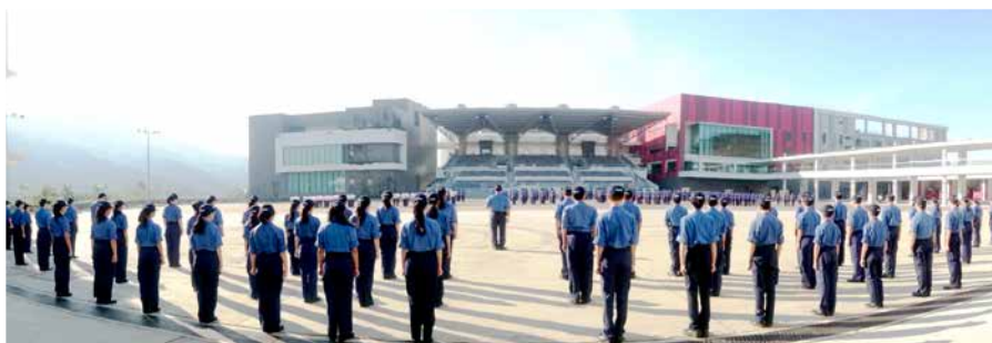
只要有信念，再猛的烈陽都不怕