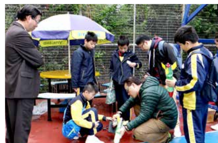
為比賽作最後準備