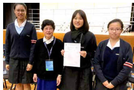
女子集誦組在校際朗誦節榮獲亞軍