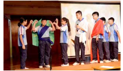
S1A students performing Pandora's Box