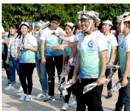
友誼第一，比賽第二