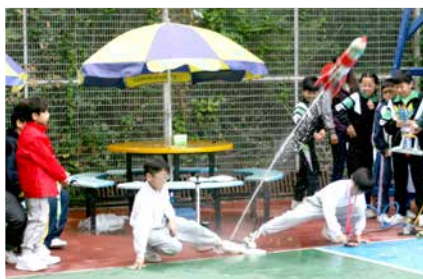
小小科學家的作品，一飛衝天！

為提高學生在科技及數學(STEM)範疇的興趣，本校與中國文化院(香港)合辦水火箭大賽暨魔力橋(Rummikub)邀請賽供全港小學生參加。在是次比賽中，我們期望同學能把知識融會貫通、學以致用，從而啟發創新精神、運用邏輯思維能力，以增強同學自信心，及培養同學勝不驕、敗不餒的高尚情操。當日活動盛況空前，多間小學都派出其精英參賽，水火箭比賽場上水花四濺，觀眾情緒亦為之高漲；另一邊廂，魔力橋比賽亦鬥得難分難解，彷彿聽到每個小腦袋運轉的聲音。經過一輪激戰後，各個優勝者亦相繼出爐，比賽在一片祝賀聲中圓滿結束。