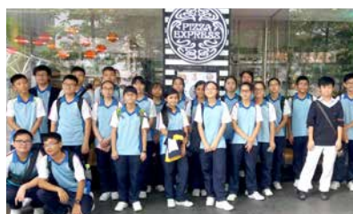
A visit to Pizza Express