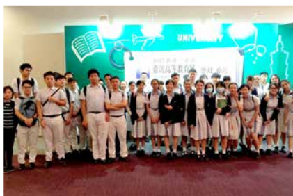
台灣高等教育探索活動2017