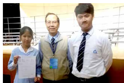
男女子集誦在校際朗誦節榮獲季軍