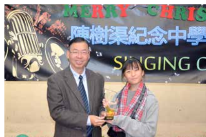
學生會舉辦一年一度歌唱比賽