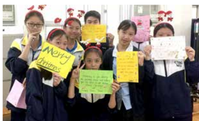
A group of students with their finished Christmas cards