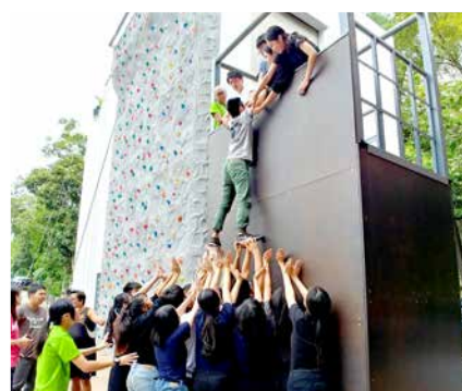
勇於面對挑戰的畢業班同學