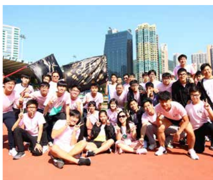
畢業跑，跑出美好人生