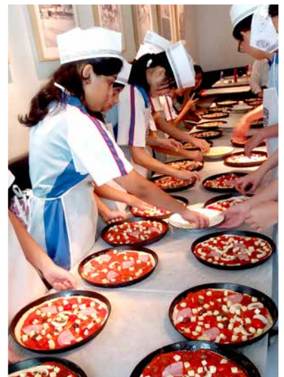
Master chefs at work