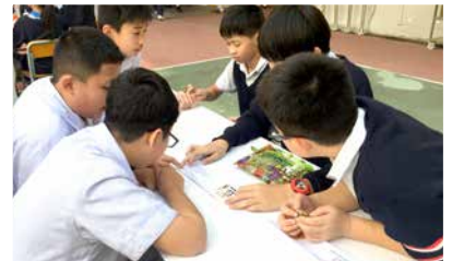
Students trying to solve a riddle for Halloween