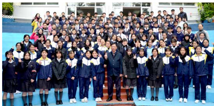
獲得三甲、金獎等同學與招校長合照

詩的大意指新年伊始，從聽到狗吠的聲音引發，寫香港社會的現況；很多人愛狗，以之為寵物，呵護備至，甚至於為牠們修剪皮毛，羅綺披身，毛鞋穿腳。歷史上，西晉名士陸機有狗名「黃耳」，此犬點慧聰明，能解人語；陸機曾在牠頸上繫以竹筒，內藏家書，由洛陽送到家鄉蘇州，家人接書信，並作回覆——狗之作為信使實不下於人；最後，期望新的一年，我們能以狗的健壯，彼此努力協作作結。