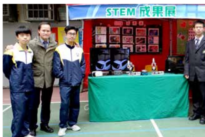
我校師生分享STEM的學習成果