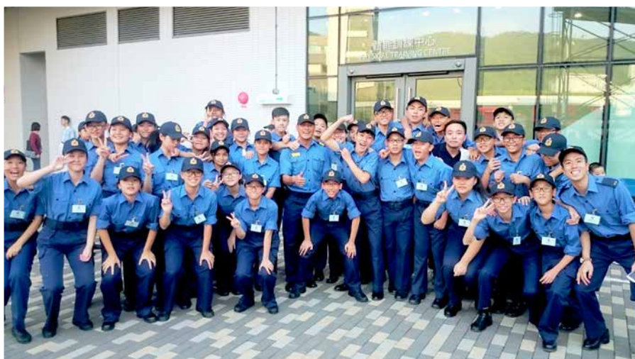
五晝四夜後，終於可以放鬆一下了

我校於十月三十日至十一月三日參與了由教育局和消防及救護訓練學校合辦的「多元智能訓練挑戰營」。在五晝四夜的訓練裡，學生與消防員一同受訓，體驗消防員的艱辛。面對不同挑戰，學員在磨練中堅持，在批評中自省，在困難中合作，四十位同學一同蛻變。高峰是留給心靈強大的人，相信這次體驗，能使同學明白「大無畏」精神，自律自強、永不言棄、持定目標，朝更高的山進發。