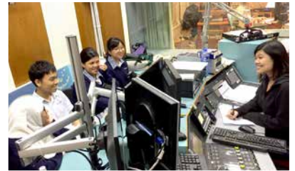
Students recording for Teen Time