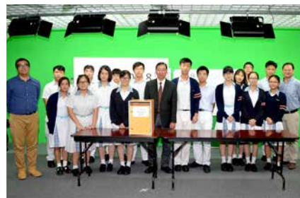
有你信任的一票，我們會更努力做好

學生會的鍛煉讓我們受益良多，從搬運桌椅到籌劃大型活動，都是訓練我們和讓我們成長的契機。期待下學期我們有更好的表現，不會辜負支持和信任Inherit的同學！