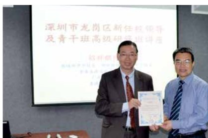
領導互相交流切磋，促進教學效能