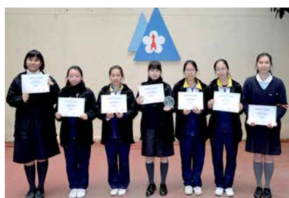
學友社舉辦全港十大新聞選舉，我校取得「最具新聞觸覺獎」