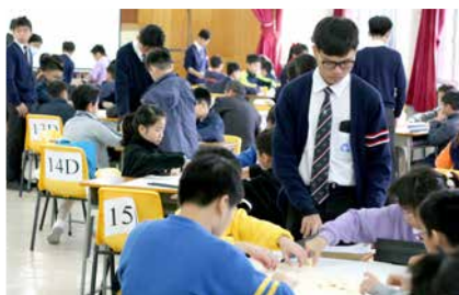
過百名小學生齊集禮堂進行比賽