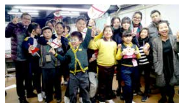
親手做的手工最美麗