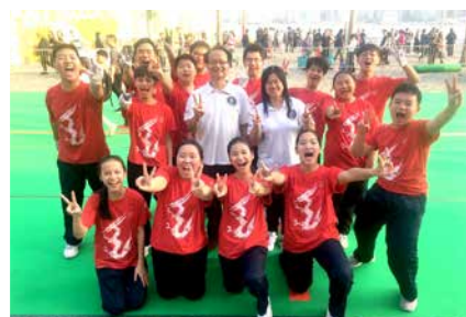
本校步操樂隊在香港步操管樂節勇奪四金及四項特別獎