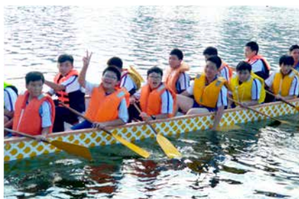
「參與運動、拒絕毒品」龍舟訓練計劃