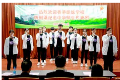
看同學們唱得多陶醉