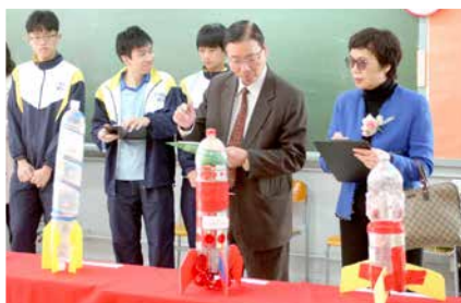
評判們聚精會神地評分