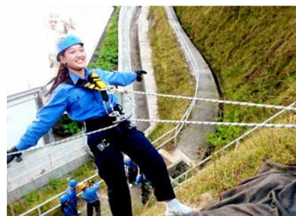
相信自己，就能做到