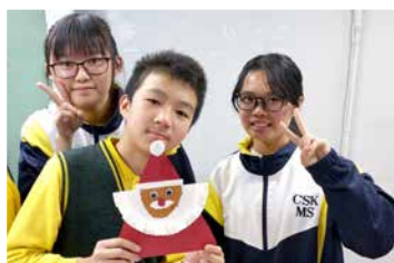
同學們帶領兒童做聖誕手工

去年十二月，本校中四及中五級修讀視覺藝術科的同學在老師和幾位藝術家的帶領下，到訪位於彩虹村的香港聾人協進會，和一群聽障兒童一起做手工慶祝聖誕。稍後藝術家還會和中四同學一起創作藝術品，表達對聽障兒童的關懷，作品會於四月十八至二十二日，在本校的藝術展上展出。