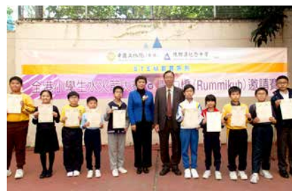
頒獎嘉賓與得獎者留影