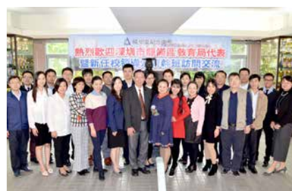
難得聚首一堂，少不了的大合照