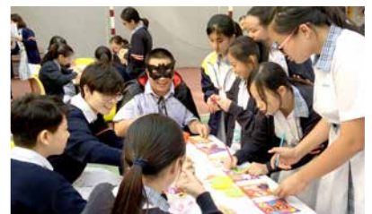
Students making Halloween decorations for the school