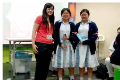
模擬職場：最出色員工